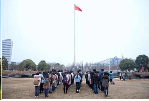
(2) 升旗手升旗照（远景/近景拍摄均需有国旗做背景）